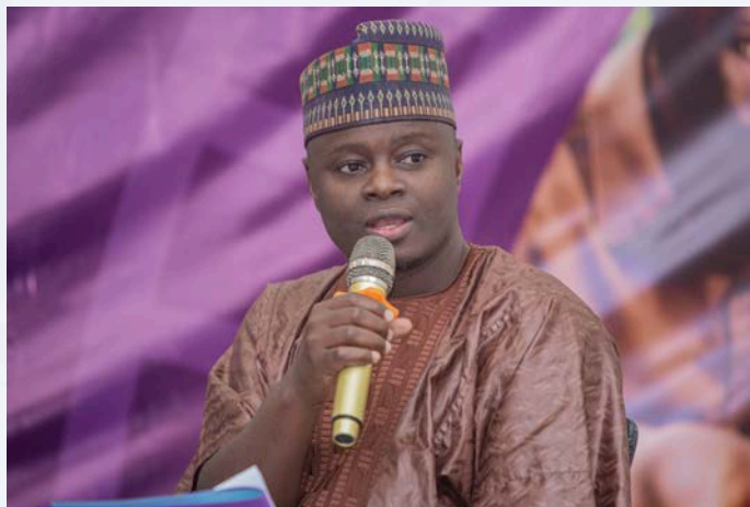
Honorable Yacoubou OROU SE GUENE