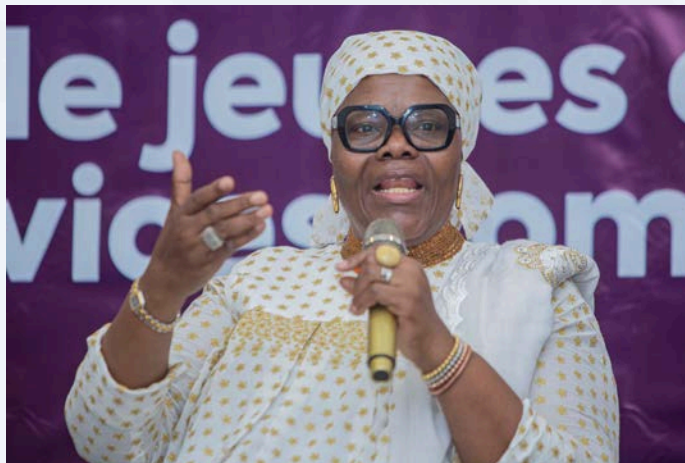
Honorable Sofiatou SCHANOU AROUNA

Cette session a ainsi posé les bases d'une collaboration durable entre parlementaires, jeunes et OSC, autour d'une vision partagée : faire de la redevabilité et du partenariat stratégique des leviers pour un accès universel à la SSR au Bénin.