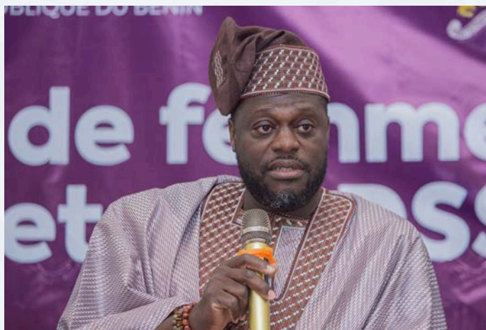
Honorable Brice FAGBEMI